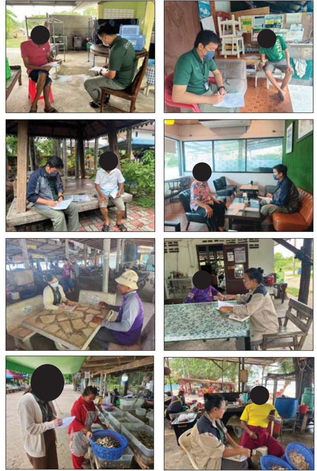
รูปที่ 2.4.4-1 (ต่อ)

รายงานการสำรวจความคิดเห็น โครงการโรงงานผลิตสารพิษ